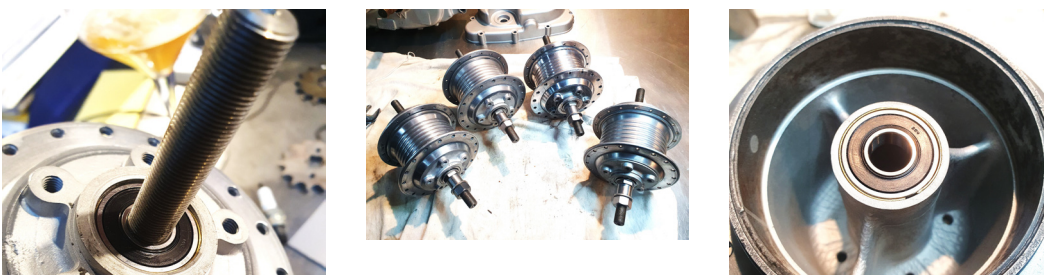
Eindresultaat van herstelde en gelagerde achternaaf.